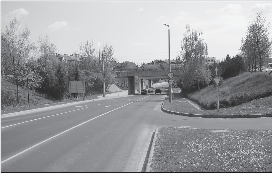
Sopron, Frankenburg úti aluljáró