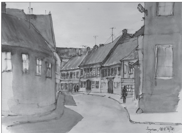
Kubinszky Mihály: Szentlélek utca, akvarell, 1969. (A Kubinszky család tulajdonában)

A városépítési tevékenység körébe tágabb értelemben mindenfajta településsel és települések környezetével, az ún. városkörnyékekkel kapcsolatos műveletek is beletartoznak. Szokásos a városrendezés szinonimájaként említeni, de a két fogalom nagymértékű egybeesése mellett a városrendezés elsődlegesen a városépítés tervezési-szervezési oldalát jelenti. Ugyancsak szokásos az urbanisztikával helyettesíteni, ennek a gyűjtőfogalomnak azonban a városépítés csupán egy szektorát képezi. [...] Elméleti alapját elsősorban a településtudományi kutatások eredményei szolgáltatják, de hasznosítja más műszaki és társadalomtudományok ismeretanyagát is.” 8